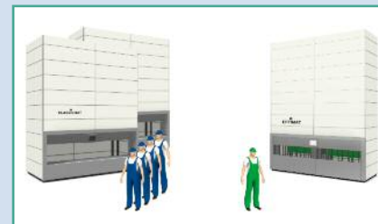
Gegenüberstellung Personalaufwand zwischen ClassicMat™ und EffiMat®

Neuartige Verkleidungstechnik schafft eine messbare Geräuschreduzierung. Für eine noch schnellere, flexible und kompaktere Lagerung (bis zu 12 Meter Höhe), verbunden mit einer besseren Ergonomie, empfehlen wir den EffiMat®. Dieser bewegt nur die angeforderten Behälter statt des gesamten Tablars. So wird die Zahl der vertikalen Bewegungen drastisch reduziert, was eine 4 bis 5 fache Pickleistung gegenüber klassischen Liftanlagen und bis zu 400 Bestellabwicklungen/Stunde ermöglicht.