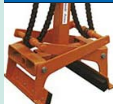
GREIF- UND HEBEZEUGE